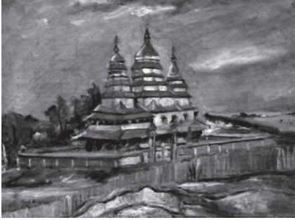
Церква в Кривчицях (Львів, Шевченківський гай). О.Новаківський.

музею «Шевченківський гай» у Львові. 2 Про підпал цієї церкви зазначали часописи, 3 а про роль стигматички у порятунку храму написав о.Г.Костельник у «Божих Слідах». 4