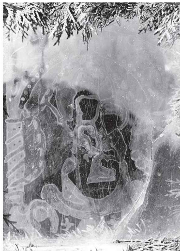
Образ на шибці в с.Чайковичі, Львівська обл. (світлина 1938 р.)

Тогочасні фахівці наголошували на незвичайності сюжету а також на особливій чіткості зображення чайковицького образу. На шибці зображено Богородицю з малим Ісусом на руках. Груди Божої Матері пронизує меч, кров від рани скапує Ісусові на коліна. Лівою рукою Він тримає кулю-світ з хрестиком – знак царської влади, правою рушничком обтирає кров