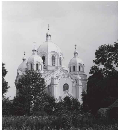
Мурована церква у с.Стоянів, Львівська обл. (світлина 1996 р.)