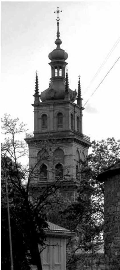
Вежа Успенської церкви у Львові. Сучасне фото.

Коли ви у Львові, не пожалійте труда, підіть на Руську вулицю та подивіться на головний хрест на вежі успенської церкви. Побачите дивне явище. Від сторони Ринку той хрест начеб був щойно позолочений ; а від сторони Валів, з протилежного, північного боку, той хрест зовсім чорний . Це не є ніяка оптична злуда. На успенській церкві, крім того хреста на вежі, є ще шість менших позолочених хрестів: три на тих трьох банях церкви, що їх видно з Руської вулиці, і три на трьох банях каплиці, що на подвір'ї. Всі ті хрести почорнілі.