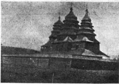
Студитська церква на Кривчицях коло Львова. Вогонь був підложений в фронті по правому боці обривка.

При кінці серпня 1937 р. львівські часописи донесли про те, що в ночі з 21 на 22 серпня, зараз по півночі якісь злочинці підпалили дерев'яну церкву ОО.Студитів на окраїнах Львова, за личаківською дільницею, на Кривчицях 18 . Огонь удалося одразу загасити.