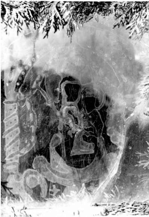
Образ на шибці в Чайковичах.

у Стоянові підтверджує, що Евстахія дійсно має видіння святих осіб.