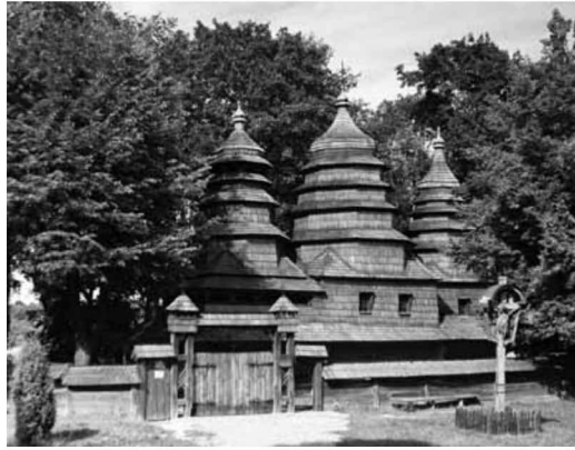
Сучасний вигляд церкви оо.студитів. Шевченківський гай, Львів.

Хоч які це неімовірні факти (наче з якоїсь казки), ніхто з нас, що день у день приходимо до Евстахії і знаємо пасмо її дивних переживань, не сумнівається в їх правдивості. 1) Ми самі нераз були свідками подібних, природно неможливих, фактів в Евстахії Бохняк; отже тут описані факти стоять у повній гармонії з цілою системою явищ в