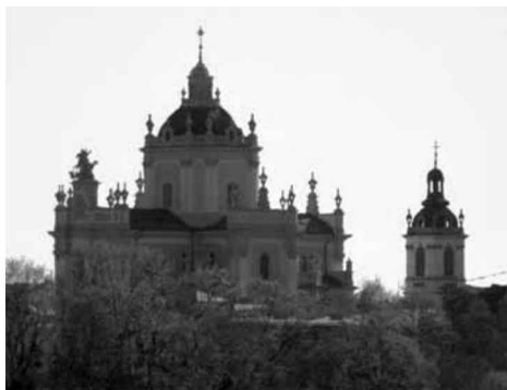
Собор св.Юрія у Львові. Сучасне фото.

В березні 1939 р. кілька разів вразило мене, що заходяче сонце так дуже відблискується від кулі під хрестом на архикатедрі св. Юрія у Львові. Куля під хрестом на свято-юрській дзвіниці також світилася, але вже не так дуже. Я знав, що обі ті кулі почорнілі, обложені брудом, бо я не раз на них дивився також через лъорнетку. Я собі думав, що при західному сонці так світять деякі дрібні місця на тих кулях, менше обложені брудом, а їх відблиск для очей зливається в одну цілість. Але одного дня при кінці березня я поглянув зблизька на кулю під хрестом на церкві св. Юрія: зі сходу вона темна , а від заходу чиста, позолочена . Зараз я пішов до Евстахії Бохняк. Застав її, як впадає в хрестну екстазу. Я не міг здержатися і запитав її, чи вона не відновила хреста на церкві св. Юрія? Хоч це належить до рідких виїмків, щоб Евстахія в хрестній екстазі відповідала на питання (тільки коли справа дуже важна), Евстахія відповіла: „Так, татусю (вона мене так називає), я відновила один бік, від заходу сонця, але ще раз маю його покрити золотом. А кулю на дзвіниці я тільки зачала відновляти”.