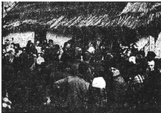
Вікно хати Якова Городиського оточує і в день і в ночі натовп людей.

Власник хати Яків Городиський звернувся до пароха з проханням, щоб на місці хати вибудували каплицю для образу Богородиці. Городиський безоплатно жертвував землю, на якій стояла хата.