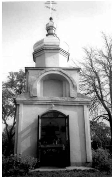
Проект 1939 р. та капличка, збудована 1998 року.