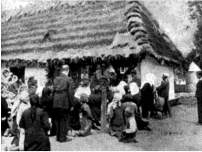
Прочани біля хатини з образом. Позаду видно криницю з чудотворною водою.

ла щільно дошками обгородити, та треба дати замок, щоб можна удержувати чистоту; при таких масах народу, які приходять до Чайкович, на те дуже треба зважати.