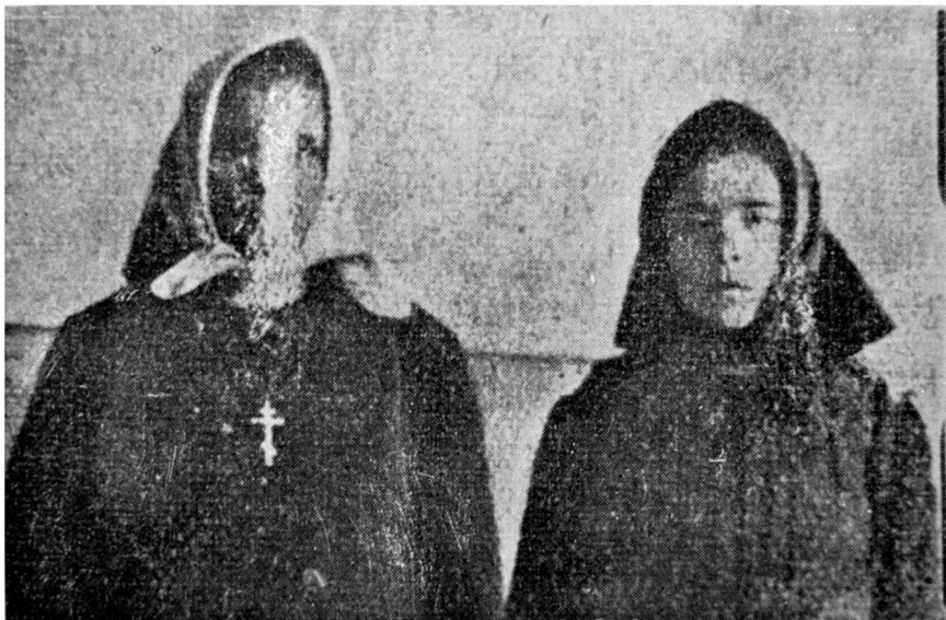
Фотографія сторінки з книжки Ю.Чижевського

дивився на ту фотографію і подумав собі: “Яка файна дівчина, фاینіша, ніж її товаришка, а помімо того має рани Христові! Світ любить красу, а вона не прихилилася до світа, лиш до Бога.” Потім я закликав свою жінку, показав їй ту фотографію в книжці і перед нею висказав ту свою думку. Жінка також ствердила, що