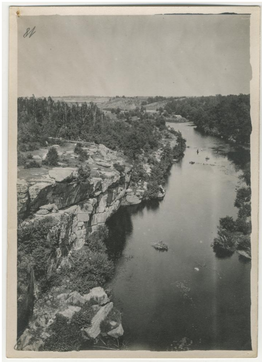
Містечко Іскорость, скелясті береги р. Уж. Світлина 1909 р.

призванія сѣверными славянами Варяговъ, одно изъ Славянскихъ южныхъ племень, извѣстное въ лѣтописяхъ подъ именемъ Деревянъ впоследствии Древлянъ, соединившись въ одно цѣлое и избравши изъ среды себя князей, образовало сильное царство, столицею котораго былъ Коростень, какъ по самой природѣ имѣвшій довольно укрѣпленныя позиціи, въ древнемъ Коростенѣ, кромѣ княжескаго замка, было еще три оборонительныхъ терема или башни, носившихъ названія: высокаго, средняго и низкаго; всѣ они были расположены на неприступныхъ почти гранитныхъ берегахъ р. Уши.