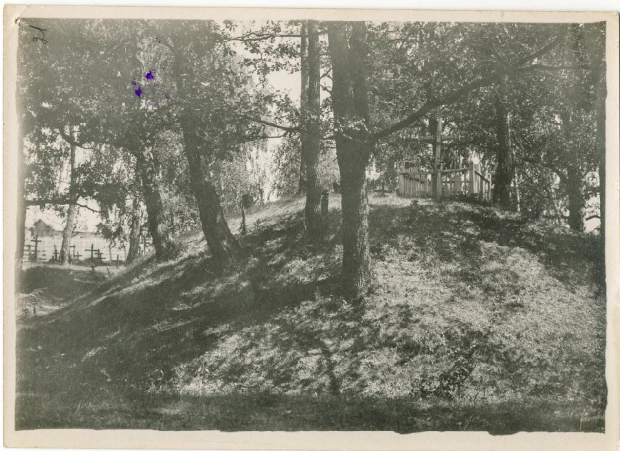
Містечко Искорость. Великій курган та кладовище. Світлина 1909 р.

Изъ всѣхъ этихъ грозныхъ укрѣплений, защищавшихъ нѣкогда древній Коростень въ теперешней Искорости едва остались ничтожные слѣды, которые скоро со всѣмъ изгладятся—такъ какъ рука времени и людская заботливость сильно кладутъ на нихъ свою печать разрушенія и уничтоженія; одни только гранитные скалы вертикально торчащія надъ Ушью съ одной стороны служили и будутъ всегда служить неприступнымъ оплотомъ м. Искорости.