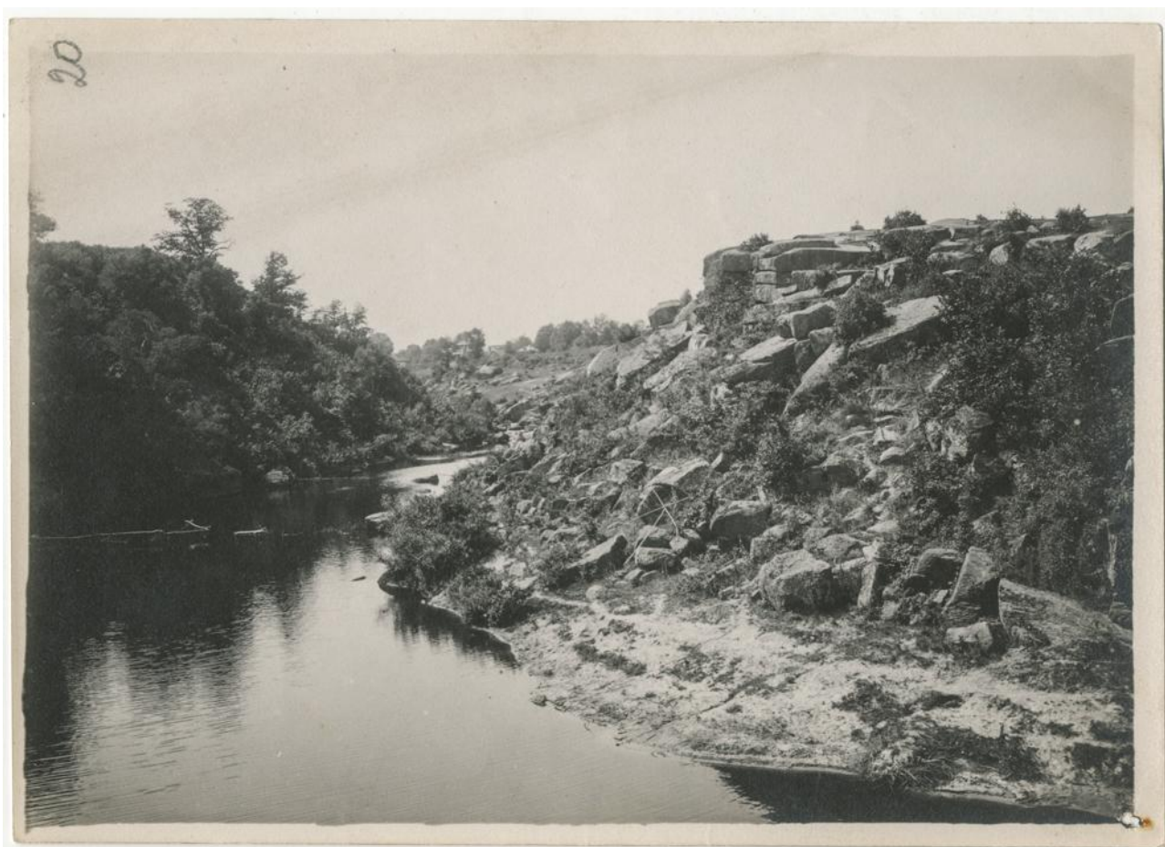
Містечко Іскорость, Городище біля р. Уж. Світлина 1909 р.

Но не долго суждено было Коростеню просуществовать своею самостоятельною и самобытною жизнію. Въ 883 году Олегъ Великій Князь Кіевскій, взявши приступомъ г. Коростень, все царство Древлянское присоединилъ къ Кіевскому княжеству и обложилъ его данію[2]. Правда дорого обошлось Олегу взятіе Коростеня; много дружины и много времени потрачено было, пока успѣлъ онъ овладѣть Коростенемъ[3]. Съ тѣхъ поръ Коростень, хотя считался столицею Древлянъ, но вѣроятно много утратилъ блеска и величія изъ своей прежней независимой жизни; впрочемъ можно предполагать, что Олегъ, сдѣлавъ Древлянъ своими данниками, оставилъ ихъ при своихъ прежнихъ порядкахъ, законахъ и управленій, что можно видѣть изъ того, что онъ не тронулъ даже ихъ князей.