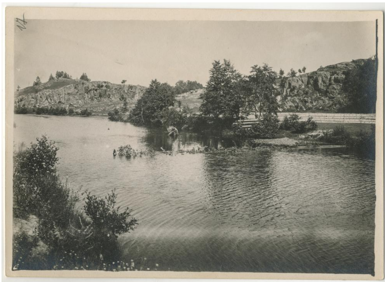
Містечко Іскорость, Краєвид біля р. Уж. Світлина 1909 р.

Послѣднее предположеніе оправдывается и преданіемъ которое говоритъ, что тамъ на этомъ мѣстѣ нѣкогда была церковь, основанная будто Княгинею Ольгою, когда она приняла св. Крещеніе, возвратившись изъ Константинополя, и что церковь эта существовала долгое время пока не была разрушена Литовцами. Преданіе о существованіи христіанской церкви въ Искоростп до времени св. Владиміра подтверждается и свидѣтельствомъ нѣкоторыхъ историковъ, которые говорятъ, что христіане были и между Древлянами того времени.