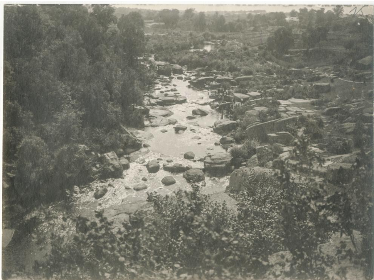
Містечко Искорость, р. Уж. Світлина 1909 р.

Искорость, теперь незначительное и ничтожное поселение, носящее название мѣстечка, расположено на берегахъ р. Уши, которая здѣсь протекаетъ среди громаднѣхъ гранитнѣхъ утесовъ, возвышающихся индѣ до 10 и 12 саж.,— отъ чего мѣстность эта съ перваго взгляда кажется дикою и печальною, но всмотрѣвшись попристальнѣе она представляется чудною и восхитительною картиною.