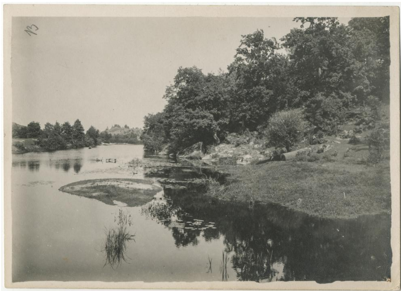
Містечко Іскорость. Красвид біля р. Уж. Світлина 1909 р.

Но этимъ еще неудовлетворилась месть Ольги, тѣнь умершаго , по тогдашнему языческому вѣрованію, требовала еще большей мести. Для этого Ольга, скрывши отъ Древлянъ свой поступокъ съ посланниками ихъ, объявила имъ, что она прійдетъ къ нимъ праздновать тризну на могилѣ своего мужа и потребовала чтобы для сего приготовили во множествѣ меды и другіе угощенія. Когда все было исполнено по ея приказанію, то она явилась съ дружиною въ Коростень и велѣла сперва насыпать высокую могилу надъ прахомъ Игоря, а потомъ приступила къ празднованію тризны, во время которой поручила отрокамъ своимъ угощать какъ можно лучше всѣхъ Древлянъ и на вопросъ о посланникахъ отвѣчать: ѣдутъ во слѣдъ за нами. Когда Древляне въ простотѣ сердца своего недогадываясь ни о какихъ коварствахъ, напились всѣ почти до пьяна, то Кіевская дружина, по приказу своей Княгини напала на Древлянъ и изрубила сѣкирами всѣхъ бывшихъ тамъ болѣе 5000 человекъ.