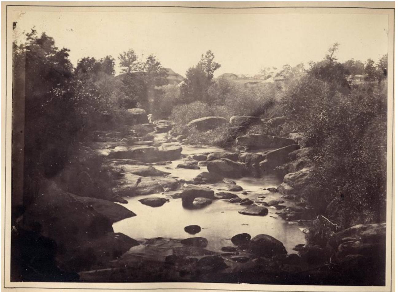
Ванны на р. Ужъ, гдѣ по преданію В.К. Ольга крестила народъ.

Вани на р. Уж, де за легендою Велика Княгиня Ольга хрестила народ